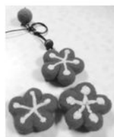
針氈半成品小梅花鑰匙圈