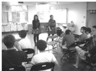
愛樂老師示範音符的節奏

台北市愛樂管弦樂團文化基金會去年底透過愛樂種子計畫，提供院童音樂學習的師資跟樂器補助，特別在2月2日下午來院舉辦「愛樂新芽合奏音樂活動」，由兩位愛樂老師~音符姐姐和愛樂姐姐帶領，讓院童從互動遊戲中學習有關樂理的知識，老師們透過活潑有趣之體節奏教學法以及有獎問答引發院童的參與動機，大家都專注學習認識音符的節奏、並勇於挑戰闖關，整場互動音樂會的氣氛歡樂融洽，孩子們對音樂也有更進一步的認識，愛樂老師還發給每個孩子一份紀念品，大家共度一個歡樂的午後音樂饗宴。