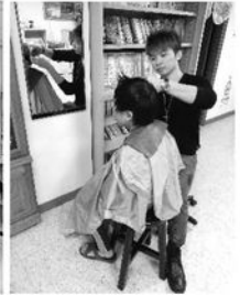
雖然環境很克難，但設計師手藝一樣厲害喔！