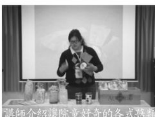
講師介紹讓院童好奇的各式菇類

剛放寒假的1月28日，菇果商行的大姊姊帶著50份的樂栽盒香菇真空包來到院裡，向孩子們介紹菌類和樂栽盒原理、使用方法，孩子們看到各樣菇類感到好奇、驚嘆，沒想到小小的太空包能變出不同品種的香菇，透過講師解說認真地吸收相關知識，並於有獎徵答中踴躍舉手發言，藉著活動院童學習到照顧香菇的小技巧，並抱著期待、興奮的心情，準備好收成自己的小菇場囉！感謝家扶基金會熱情連結菇果商行，讓孩子們也能體驗時下最夯的種香菇~