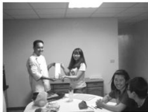
孩子們拜師學藝，廚師致贈菜刀一把

1月31日首次由協會帶領廚師團隊來到院內，一開始的拜師學藝、正式授刀儀式，讓孩子們感受到團隊們對料理的珍惜和用心，所以也非常認真學習。廚師團隊用心指導孩子們運用菜刀處理食材，並且詳細說明料理的步驟，也讓孩子們輪流示範練習，孩子在學習的過程中，不僅增進了廚藝更增加了自信心，每每課程結束後都興奮地邀請其他家的院童、老師一起分享，看來這些中繼家庭的孩子們，未來都會是新好男人、新好女人！