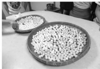
師生親手揉製手工湯圓預祝今年圓滿順遂

今年是小龍年，春節圍爐特別訂定「什麼都要自己來！」為主題，依照不同年齡層設定了不同的任務，由各樓院童組成湯圓、水餃、年菜製作團隊，不讓保育生輔老師專美於前，孩子們紛紛投入準備除夕圍爐大餐，也感受年節氣氛。搓湯圓的小小孩在社工老師的帶領下，看著黏滿雙手和著水的糯米粉糰變成一顆顆圓滾滾的湯圓，濃濃年味之外還有一種自豪的味道；包水餃的孩子悄悄在餡料裡加入「幸運銅板」，要給吃到的老師跟孩子們驚喜；幾個高中大孩子則化身大廚，穿梭在廚房製作圍爐大菜，端出耗時熬煮的東坡肉、香味四溢的客家小炒、辣炒年糕和象徵年年有餘的樹子蒸魚時驚艷全場，最神奇的，院長也吃到了包有特別餡料的幸運水餃，彷彿代表著全院一整年的好運，大家開心地吃著各種料理，最後也在孩子們的吉祥話與院長的祝福中結束舊的一年，開始向新的一年出發。