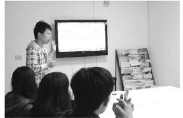
社工說明院內課輔進行之模式，新進義工專注聆聽義工規範

寒假結束，孩子們新學期的課輔服務也緊鑼密鼓的開始，上學期大部分課輔義工皆持續這學期的服務，孩子們新增的課輔需求，也紛紛招募適合的新義工，且在服務前舉行義工面談與職前訓練，由社工逐一與義工會談，以了解服務動機及澄清一些模糊的概念，除了保障服務的品質外，也引導義工依照自己的特質陪伴孩子走一段人生的道路！本學期共招募9名新進義工與孩子進行一對一課輔，期望為義工團隊帶來一股新能量！