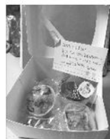
春節開工謝師禮盒

自立課程技能培育的烘焙和羊毛氈手工藝已經進入進階課程，參與人數也越來越多，儼然孩子們的夢想小小商舖已經出現雛形，尤其幾次的接待、感恩禮品都獲得極大的迴響與好評，讓孩子辛苦的付出有了最真實的回饋，但孩子們並不因此而滿足，除了每週課程學習外，也犧牲了自己休息時間進行社團練習讓自己技術更純熟，寒假期間甚至還偷偷進