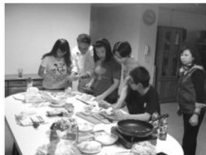
廚師們很細心的教導孩子們運刀技巧