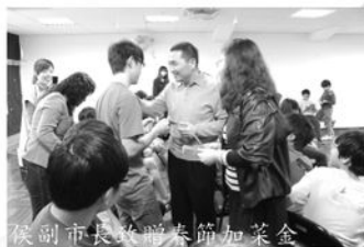
侯副市長致贈春節加菜金

春節前夕，新北市侯副市長特地來院，向留在院內過年的孩子們表達關心，除了帶來了當季的水果，還準備了春節加菜金，讓孩子們可以有豐盛的圍爐佳餚，過一個開心年節！侯副市長與孩子們自然地閒話家常，對前一年來院裡和孩子們用餐