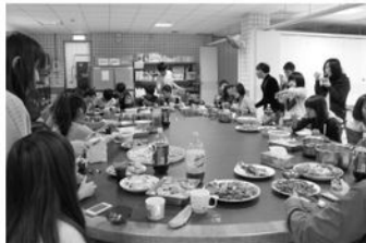
開始享用大家的成果，手慢的就只剩盤子囉！