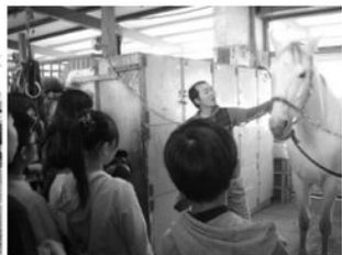
與馬兒零距離互動