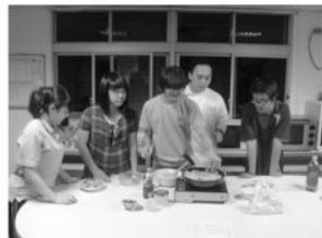
孩子輪流上陣大展身手