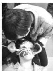
仔細描繪充滿個人風格的八家將臉譜