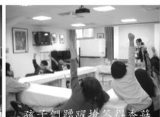
孩子們踴躍搶答得香菇