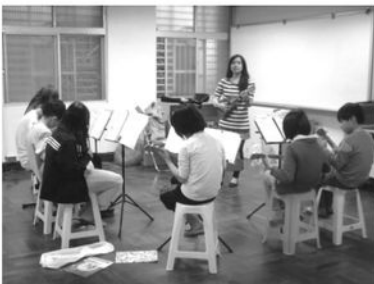
老師認真指導個別成員

今年寒假，院內舉辦了烏克蘭麗課程，小朋友們加入烏克蘭麗彈奏的學習，老師只用了短短五次的課程，就讓8位參加的小朋友從樂器介紹、基本姿勢與指法、節奏和弦練習到能夠自彈自唱好幾首世界名曲和流行歌曲，在最後一堂課時還特別安排了小型的發表分享會，院內老師們欣賞著孩子們一首一首彈唱著，對孩子們學期的成果好驚喜，大家雖然靦腆又緊張，也難掩心中的喜悅與成就感，雖然烏克蘭麗的課程暫時告一段落，期待未來持續透過音樂的薰陶，孩子們都能找到一個情緒的出口與情感表達的媒介，進而看到自己的優點、肯定自己的能力。