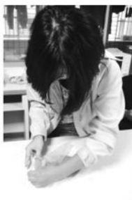
濕氈技巧不同於針氈作品也呈現不同的風格

進行了一項秘密任務，全院老師們在過完年後的第一個上班日，就收到充滿著祝福與感謝的精美禮盒，孩子的能力在累積、孩子的愛也在這些作品中流動著，請與我們一起期待下一次作品的精采演出。