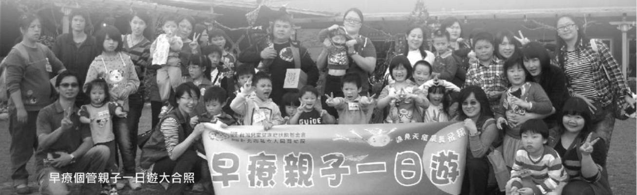
早療個管親子一日遊大合照

3月16日跟著大同育幼院的早療團隊，一起到桃園大溪的好時節農莊一日遊，我家的寶貝竟然一改平日賴床習慣，七早八早的叫叫我起床出門，8點多從大同出發到好時節農莊玩，過程中有分組活動，看著小朋友跟大朋友們認真的討論答案，認真的專心的玩著農莊的導覽豆苗姐姐為大家準備的小遊戲，遊戲中有比賽有名次有獎品，也讓小朋友很認真的希望自己能得獎，但也看到了許多小朋友未得獎的失落，也看到了小朋友懂的分享；讓小朋友們採野菜做披薩，看著孩子興奮期待的感覺，我很感動，因為發現藉由這次親子活動，讓我自己可以很輕鬆愉快的陪著小朋友玩，更拉近我跟小孩的距離，想到自己自從20年前出社會工作到有小孩，從來沒有這麼放鬆的跟小孩玩，應該有許多家長跟我一樣，每天都過著緊張忙碌的日子，沒辦法像今天一樣那麼放鬆陪伴小孩，也讓自己回到童年找回赤子之心，希望有機會可以有多點類似的活動。