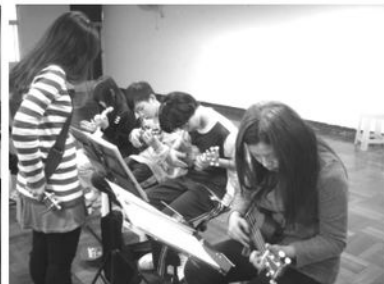
老師帶領成員彈奏指法