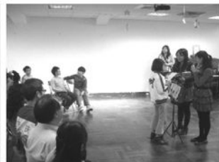
院童進行節奏闖關挑戰