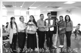
YA~拿到今年的第一個紅包囉！

仍印象深刻，所以除了鼓勵孩子們用功念書，投入在自己有興趣的領域，更與孩子們約定明年來訪要讓孩子們發揮所學，就讀餐飲科的孩子們也答應要準備六道菜招待副市長，觀光科的孩子也爭取帶領副市長在院內參訪，侯副市長則承諾要回贈孩子一個大紅包，來肯定孩子們的表現！