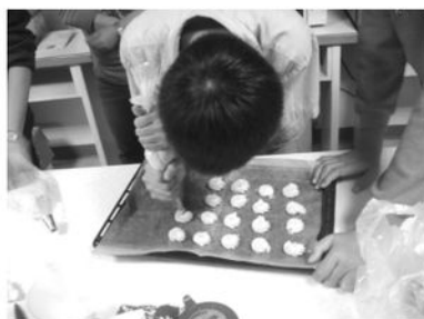
擠花袋的技術越來越熟練囉！ 看起來跟商店賣的一模一樣。