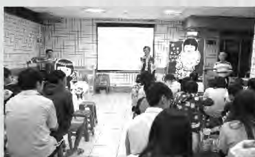
院長勉院童接受挑戰

京踩滬動之旅於 102 年 11 月 15 日晚上舉行啟動儀式說明會，大同全院院童及三個家扶中心社工代表參與，了解整個活動的行程安排及配合事項，預計在 102 年底完成四個參與單位的報名動作，於 103 年 1 月起開始維期半年的訓練測驗及最後參與名單的確定工作，感謝目前已有北京廈門商會、GARMIN(中國)、捷安特加入協辦的行列，本活動在大陸 12 天的行程包括食宿及活動的費用會由大陸台商贊助，但 32 人的機票費用對我們來說是一項負擔，長榮航空提供予我們機票的優惠，但全部的機票加上護照、台胞證的辦理也超過 50 萬元，期待熱心公益的企業社團能提供我們機票的贊助，在國內訓練期間我們亦希望透過專業團體的協助，穩定的訓練，讓這些懷抱夢想的青少年能在相關資源的協助下，順利地達成夢想的實踐。