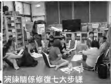
演練關係修復七大步驟