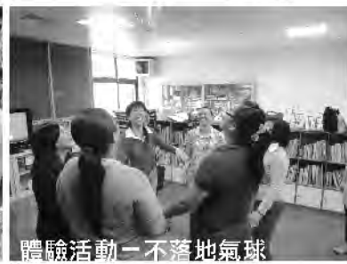
體驗活動－不落地氣球