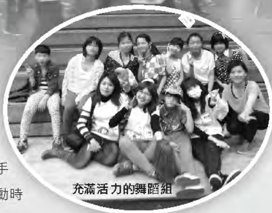
充滿活力的舞蹈組

凡是比賽就會有輸有贏，雖然能在比賽中獲得名次是很不容易的、也是大家最期待的結果，但比賽前的努力練習、參賽隊伍的團結合作、比賽中的認真參與、以及場邊啦啦隊的熱情加油打氣，這些也都是大同孩子們在運動會中最棒的收穫與參與經驗，相信這些都能成為孩子們最難忘的回憶。