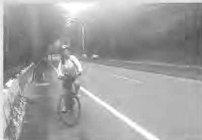
辛苦的連續上坡路段