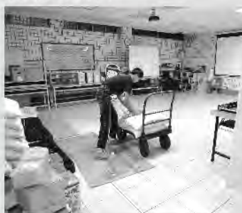
物資銀行行政人員招募測驗

經過緊鑼密鼓的籌備之後，12月26日舉行大同物資銀行啟用記者會，透過該記者會向社會宣布新服務的展開。