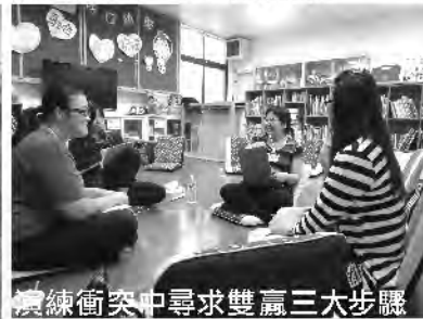
演練衝突中尋求雙贏三大步驟