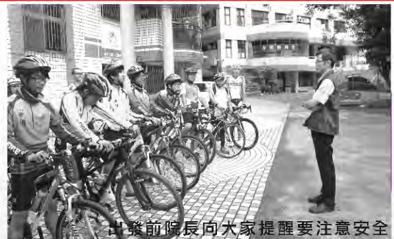
出發前院長向大家提醒要注意安全

民國 100 年大同小勇士本著目標、體驗、圓夢的理念，實踐成功挑戰攀登雪山及橫渡日月潭的目標；102 年則從 3 月起持續的訓練，本欲於 8 月底完成四天三夜中和宜蘭的單車騎程，沒想到因連續兩個颱風的影響，延至 11 月縮短為兩天一夜的中和新竹之旅，雖然目標改變了，參與的院童亦成功達成任務，也為新年度更大的目標與夢想紮下基礎。