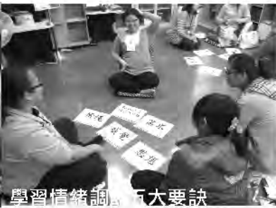
學習情緒調節五大要訣