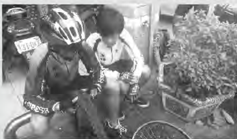
大孩子協助同伴更換內胎

第二天，雖然前一天累積了不少疲勞，但是歸心似箭的心情似乎感染了所有的人。回程的上坡路段比較平緩也比較少，所以進度很快，大約11點就已經騎完2/3的路程。回到院內的時間剛好下午1點整，孩子們對這件事感到非常驕傲，也對自己更有信心，還跟老師約定下次要騎到苗栗，也利用這股勁頭再跟大家宣導明年的單車神州計畫，成員們也承諾下次還要再參加，今年的大同小勇士也畫下完美的句點。