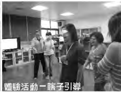
體驗活動－瞎子引導