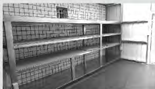
整理後的物資倉庫