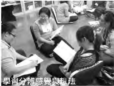
學習分辨感覺與想法