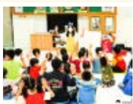
▲鬆餅姊姊透過繪本傳遞兒保重要訊息