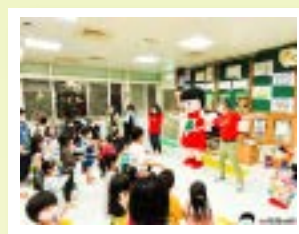
▲兒保娃娃帶領現場大小朋友一起跳兒保操

家扶基金會第9年推動「4月28日兒童保護日」，今年全台串聯呼籲 No More Sorry，希望社會大眾關懷身邊兒少，及時協助，不要等遺憾發生後只能抱歉與遺憾。然而大同育幼院在這天於院區辦理「428 作伙來」的宣導活動，用多元、有趣的元素融入在宣導活動當中，邀請民眾參與，阻止兒虐事件，關注就是給最好的幫助！