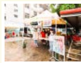
▲活動入口報到處防疫工作不馬乎

別忘了您的關注就是最好的幫助，你我都可能是最接近孩子的人，讓我們一起挺身而出吧！我們明年見！