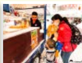
▲胖卡餐車熱心公益免費的餐點