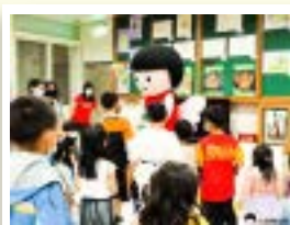
▲看到兒保娃娃興奮的孩子們紛紛向前與其互動