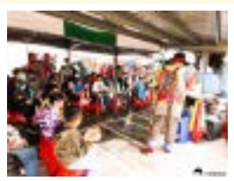
▲美食搭配精彩的魔術表演度過下午的快樂時光