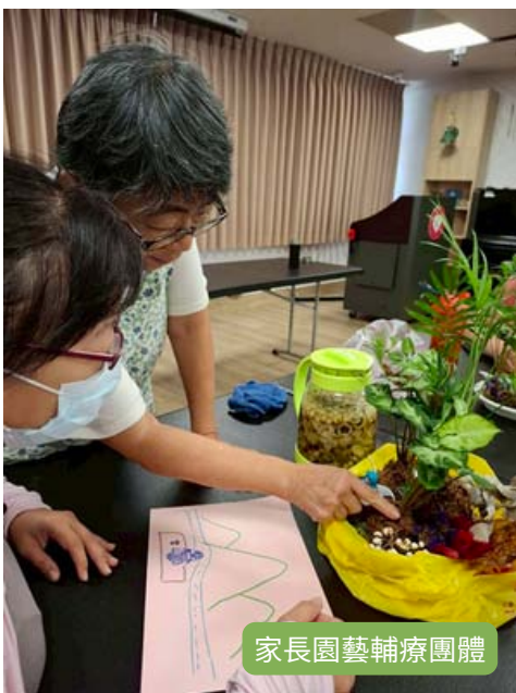
家長園藝輔療團體