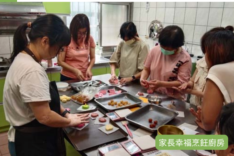
家長幸福烹飪廚房