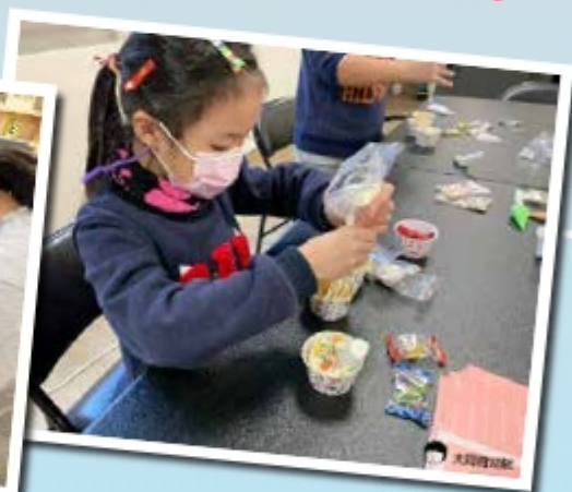
▲用心的裝飾杯子蛋糕

「節目不無聊實驗室」一直是很受大家喜愛的活動，這次選擇在聖誕節前夕，帶著孩子們來做點有趣的作品。