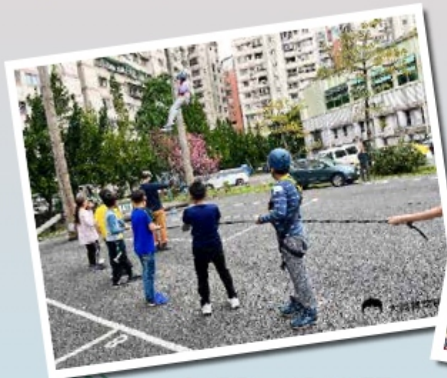
▲『大擺盪』，挑戰你的極限