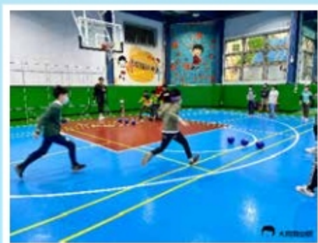
▲美式躲避球—分組比賽