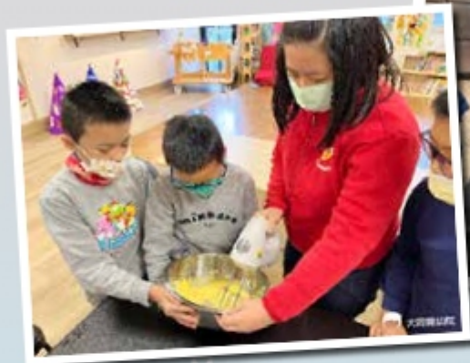
▲同心協力混合材料，製作成麵糊