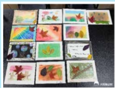
▲屬於營隊獨一無二的回憶