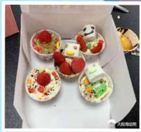
▲獨一無二的聖誕杯子蛋糕