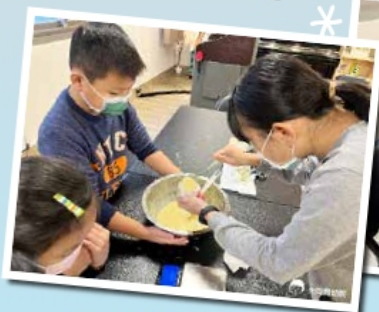
▲小心翼翼將麵糊裝入杯中