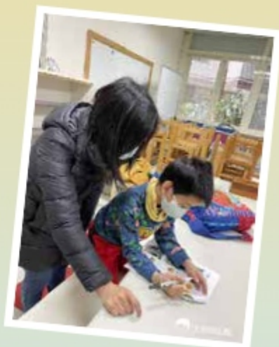
▲孩子自填回饋問卷

回程的遊覽車上(搭遊覽車也是許多小孩第一次解鎖呢!)，認真看著哆啦A夢和大雄一起冒險，把開心的旅程玩好玩滿，好時節加上好朋友，就是開心的一天!