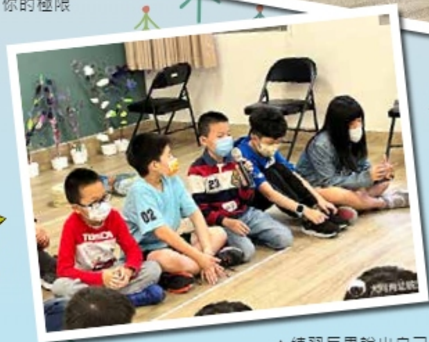
▲練習反思說出自己的感覺