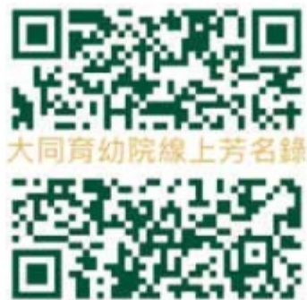
大同育幼院線上芳名錄

https://donate.ccf.org.tw/60/donation-funds/