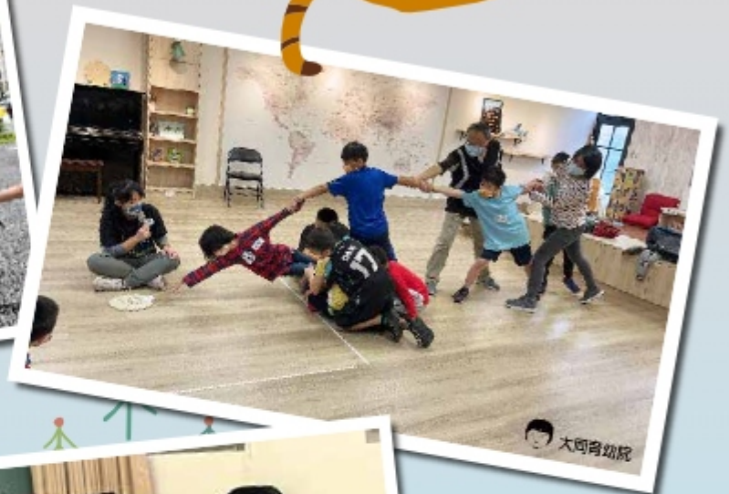
▲『時光隧道』，合力取物