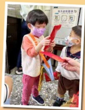
▲謝謝老師們的紅包 祝大家新年快樂