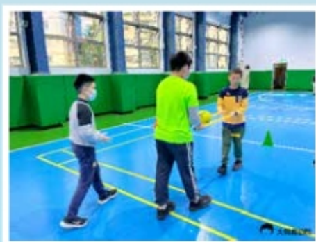
▲透過闖關活動學習團隊合作

最後以和諧粉彩創作作為營隊結尾，所有孩子一起共讀，一起進入《男孩，鼯鼠，狐狸與馬》的繪本世界，透過這樣的方式讓成員平靜心情，再讓孩子們在院區裡探索，尋找最貼近自己靈感的大自然媒材，搭配粉彩創作來整理這三天的回憶。