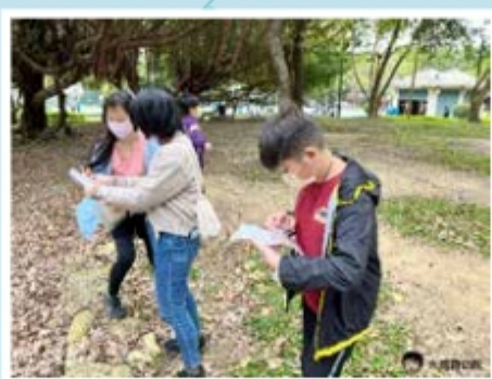
▲定向越野—善用工具，找出關卡位置