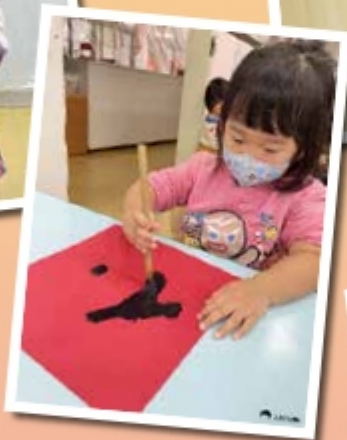
▲看我大筆揮毫、 大展身手一番