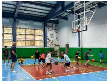
▲大同盃籃球賽-國小組