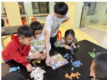
▲ 講師引導大家練習團隊溝通

以往課後社團是招收國小高年級及國中生，這次活動特別開放國小中低年級的孩子，並首次開放家長一起報名參與，讓親子們可以一起玩樂、一起學習、一起成長～