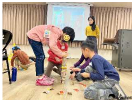
▲ 成員齊心協力挑戰《超級犀牛》