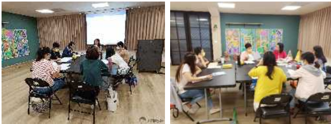
▲ 轉銜主題講授 ▲ 主題經驗交流