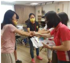
▲ 備課&演練上場打氣