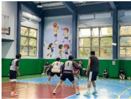
▲大同盃籃球賽-高中組

從國小階段培養籃球的興趣，雖然年齡層較小，但比賽內容也相當精彩，國高中組的比賽競爭更為激烈，也可看到技術與能力的展現，大家都將自己最棒的一面展現出來，最重要的是都能尊重對手及裁判，完美詮釋了運動的精神與該有的態度，期待未來能透過交流賽事展現持續學習與進步成果。