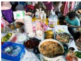
▲超澎湃美味的點心

工阿偉哥你一言我一語的，終於一個個開心的拿著鋤頭輪番上陣鬆土，然後親切的哥約了大家種珠蔥，就這樣小農夫們這陣子時常在開心農場務農，等待著豐收的那一天。