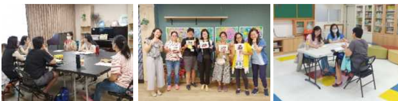
▲ 演練後心得交流討論 ▲ 團體結業歡喜合照 ▲ 團體後個別諮詢及計畫總評量