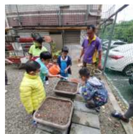
▲種了兩大盆的珠蔥