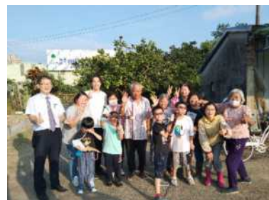
▲灰窯農園歡樂大合照