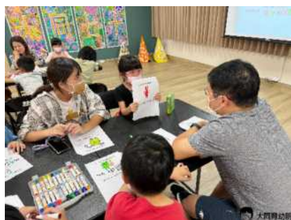
▲ 練習跟自己同桌的成員分享