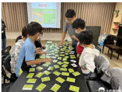
▲ 家長與孩子一起體驗玩桌遊