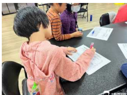
▲ 透過學習單整理自己在遊戲中的感受