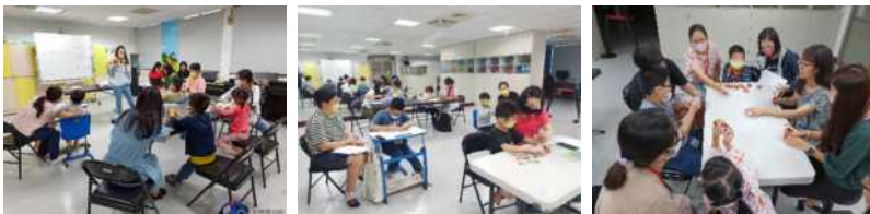
▲ 親子演練說明 ▲ 親子引導技巧演練 ▲ 引導技巧示範