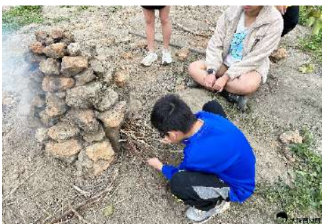
▲ 用搜集來的燃料燒窯