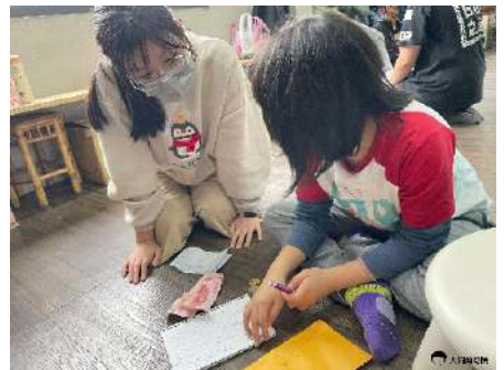
▲ 練習記帳及結算花費