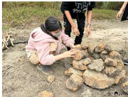
▲ 用不同大小的石頭搭窯