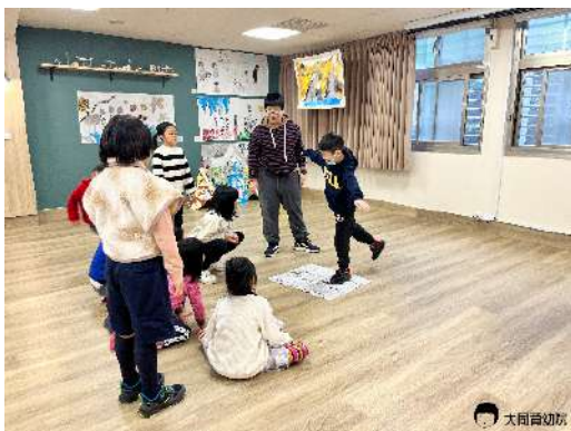
▲在有限的空間進行動物表演