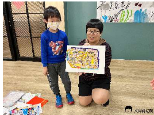
▲創意拼貼出狐蒙家園並上台分享