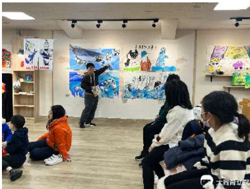
▲《線條美術館》展區導覽

小小管理員們一起經歷各國動物園真實的逃脫事件與動物園的爆笑小秘密，過程相當有趣，對於不同種動物也有更多認識。