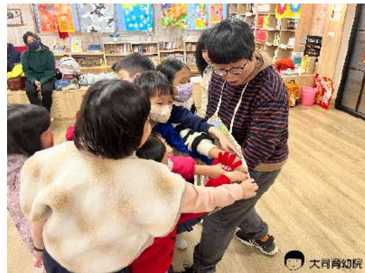
▲擔任起管理員一起找書中遺失的動物