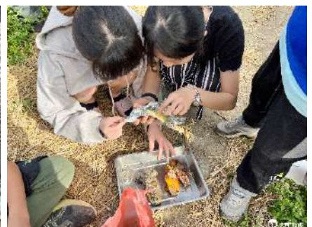
▲ 品嚐自己控窯的美食