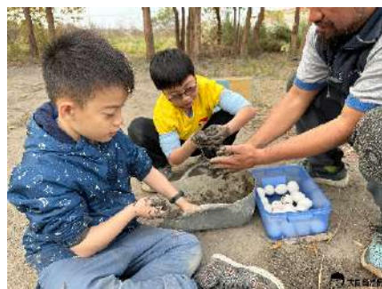
▲ 將雞蛋用泥巴包裹好